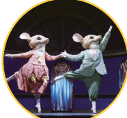
シンデレラの小さな友達