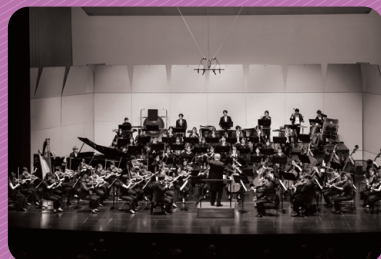
管弦楽 テアトロ・ジーリオ・ ショウワ・オーケストラ